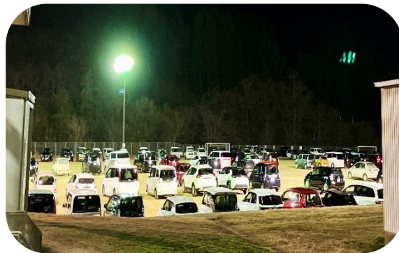
公民館駐車場陥没

石川県全域を一日午後四時十分ごろ激しい地震が襲い、能登半島では大きな被害が発生しました。被災された皆さまには心よりお見舞い申し上げます。津幡町は震度五強の揺れを観測し、地震発生後、津波警報が出されたため地区住民は高台にある英田公民館へ避難。地震で駐車場が一部陥没したため車は小学校のグラウンドへ誘導。公民館だけでは対応できず小学校の体育館も解放していただき、皆さん無事避難することができました。役場職員到着後、まずは避難者数把握のため皆さまには名前を記入していただき、その後町から毛布・水・乾パンが支給されました。津波警報が解除され多くの方は帰宅されましたが、約九十人の方がそのまま残り不安な夜を過ごしました。